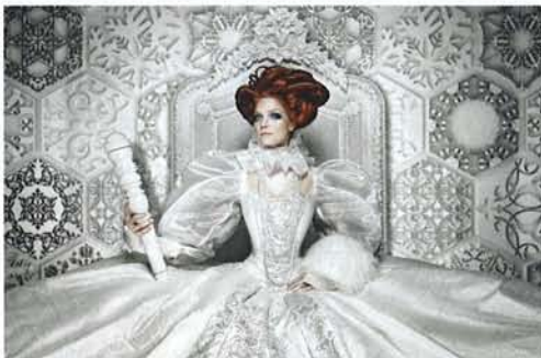
MÄRCHENKÖNIG. Vom 29.5. bis 7.7. entführt die Fotogalerie Lumas in die Welt eines Kultdesigners: "Marcel Wanders – Sculptures and Photos" zeigt u. a. die Serie "Three Queens" (Foto). Hackesche Höfe, Berlin. www.lumas.de